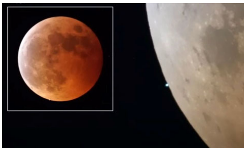
月が赤銅色になるのは、地球の大気を通った太陽光のうち

昨日は400年ぶりの皆既月食、満月が赤っぽくなり、この色はよく「赤銅色」と形容されます。